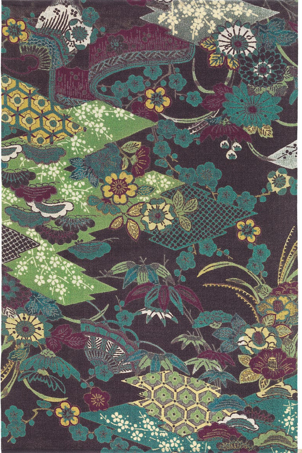
AIKO COLOUR: OCTANE SIZE: 195 X 300 CM

Printed rug in 100% wool, woven on a linen warp Design: Gunilla Lagerhem Ullberg