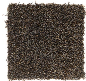
SEAL BROWN 740