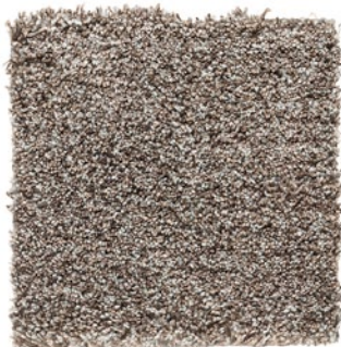
PEBBLE GREY 555

– Aus herstellungstechnischen Gründen behalten wir uns Maßabweichungen von \pm 2\% vor. – Bitte beachten Sie, dass Teppiche von Kasthall grundsätzlich aus Naturmaterial gefertigt werden. Deshalb können je nach Garnpartie und Farbbad Unterschiede in Struktur und Farbe vorkommen.