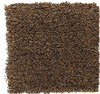
GOLDEN OCHRE 400