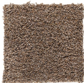
SHIMMERING BEIGE 880