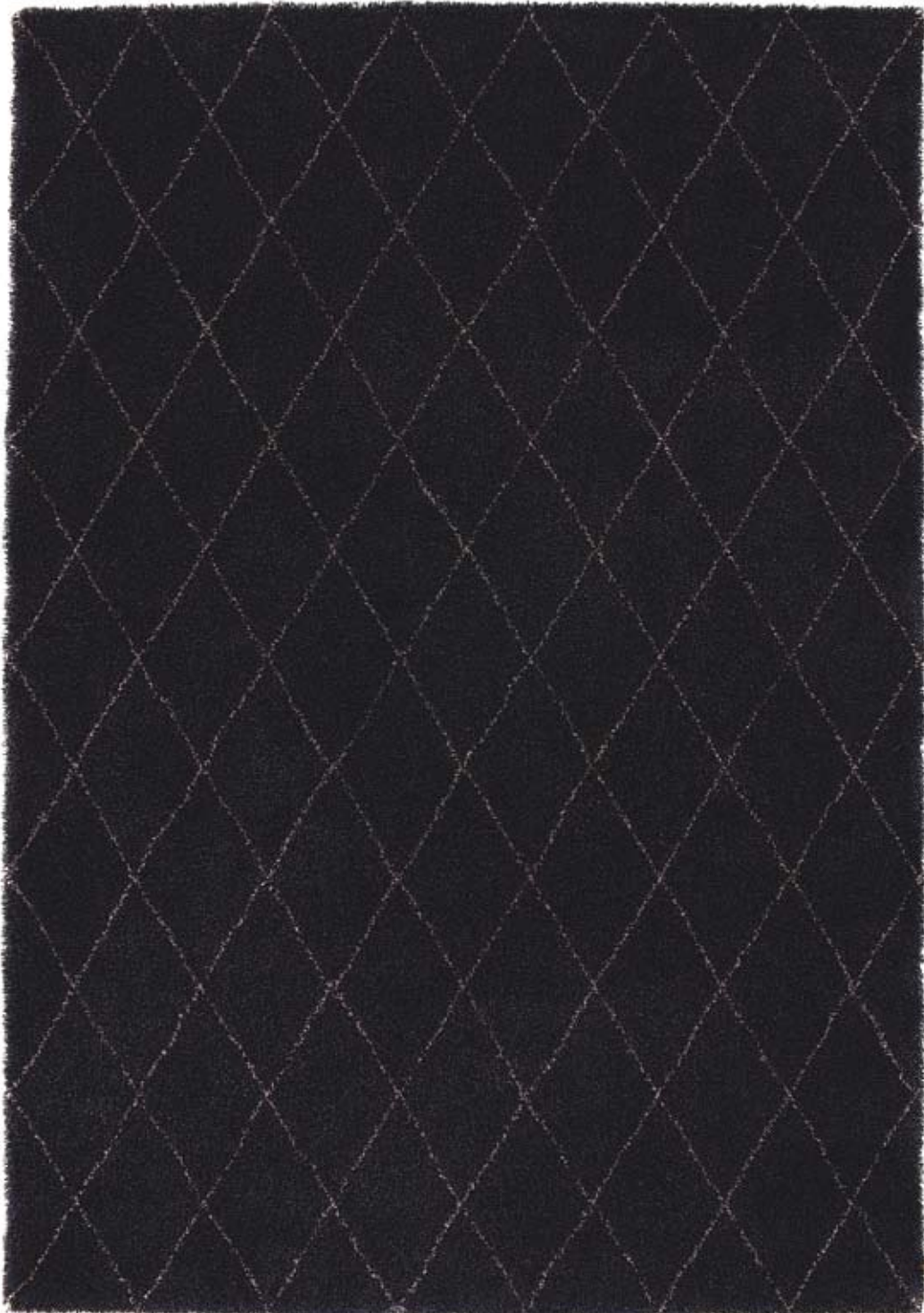
RAY COLOUR: BLACK-BEIGE 02 SIZE: 170 X 240 CM

Hand tufted long-pile rug in wool and linen Design: Gunilla Lagerhem Ullberg