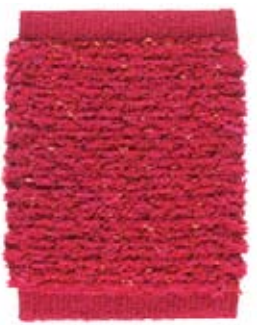
RASPBERRY RED 61