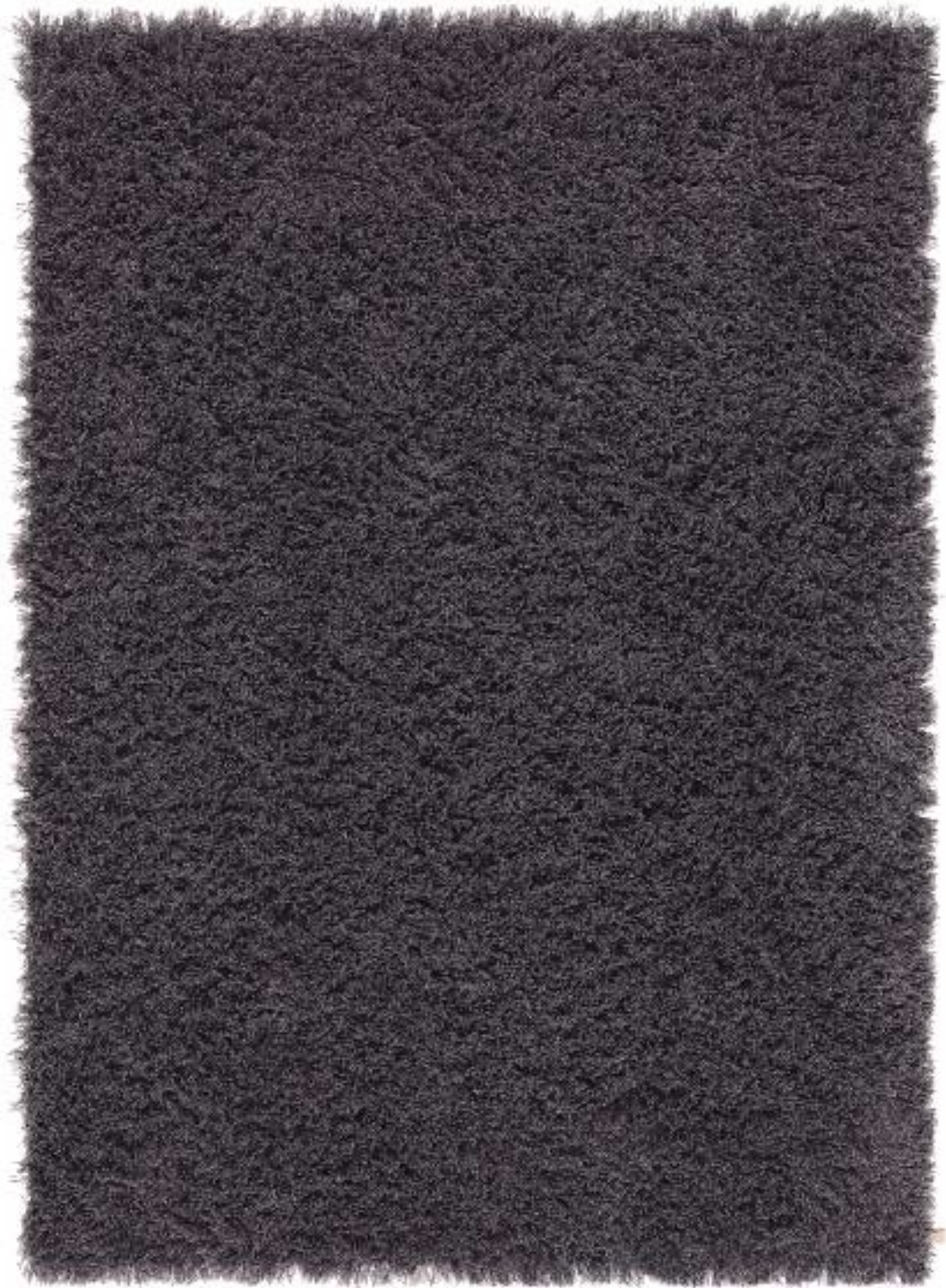
SAM HEATHER 620 SIZE: 170 X 240 CM

For the latest updates of our collection, please visit www.kasthall.com