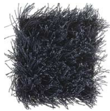
DENIM BLUE 200